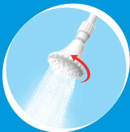
Chuveirinho Abre Fácil